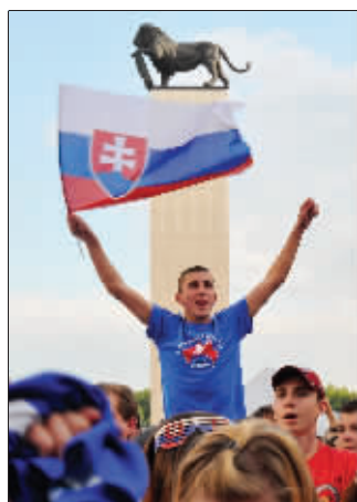
斯洛伐克取得历史性佳绩，球迷狂欢庆祝