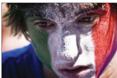
悲伤，写在球迷的脸上