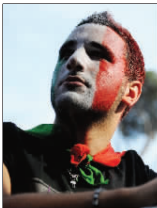
不明白，四年时间，怎会让一支冠军球队如此沉沦