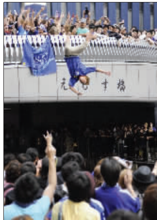
日本球迷跳河庆祝球队出线