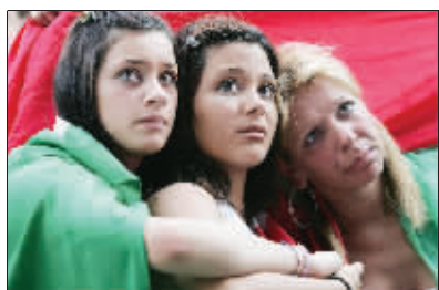
再见，心爱的蓝衣军团