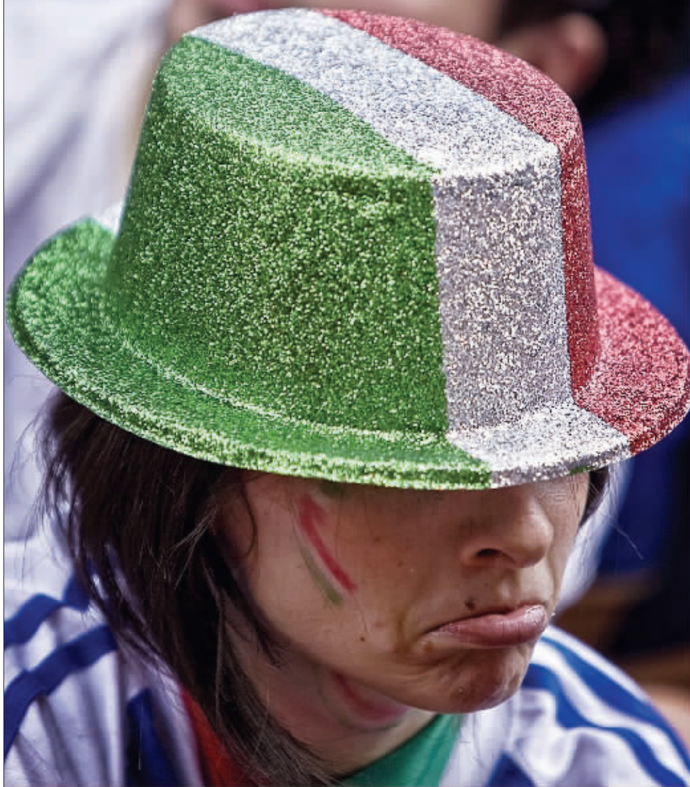
四年前，这顶帽子戴在大力神杯上，可如今……

世界杯让人癫狂，也让人断肠。蓝色巨人折戟沉沙，你看，那一张张年轻人的脸，写满了忧伤。再见，意大利。四年后，期待你们重燃蓝色梦想。