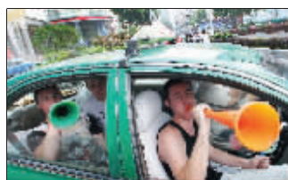
在新街口，竟然遇到几个外国球迷，吹着瓦瓦祖拉，不知的哥会不会嫌吵……