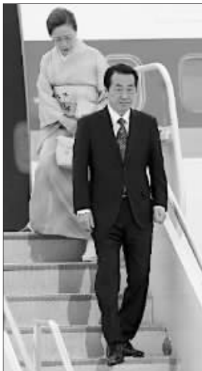
首相夫人独自一人下飞机