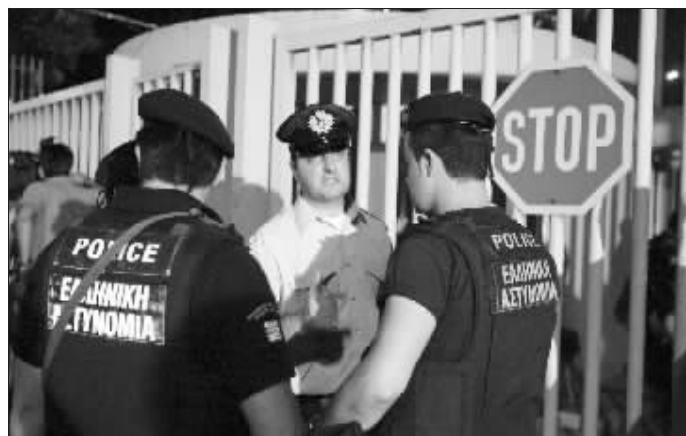
警察在希腊公民保护部大楼外警戒