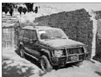
准备用于纵火的拉油车辆