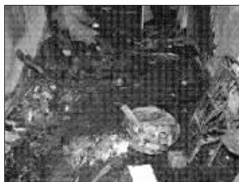
制爆、试爆时发生爆炸的现场