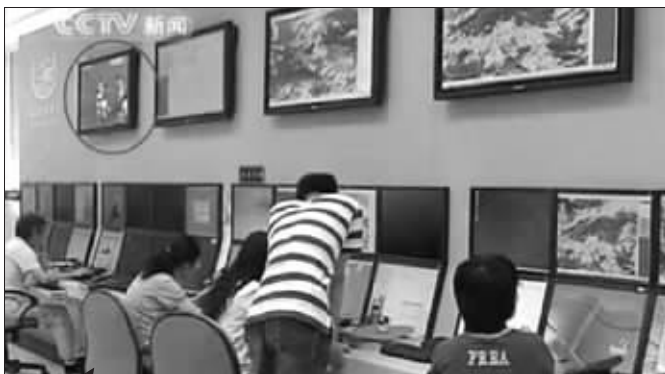
17:19 视频进行到17分19秒,气象台办公室再度出现世界杯画面

工作室里出现了世界杯画面,这有点说不过去,希望能有个说法。”不过,也有球迷网友表示可以理解:“气象台也不是转瞬即逝,非要时时刻刻盯着吗?不觉得偶尔放松一下有什么。”还有球迷更坦诚:“我就是开着word做事还上网看球的……其实这种情况是有点普遍,我想我也需要反思吧。”