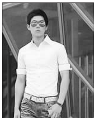
网店图片里的型男装