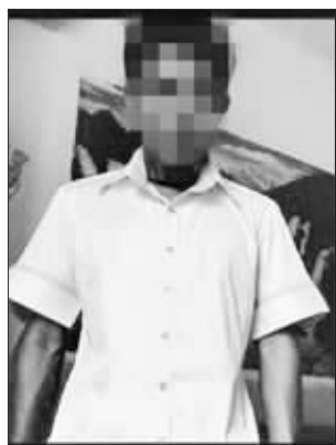
拿到手变成了“厨师服”

虽然网店东西实惠,但是总有货不对板的时候,但是本年度最货不对板的衣服,非网友“来生缘1984”莫属:“太杯具了!网上买了一件衣服,穿上后哭了!” 这名网友贴出了自己买到的东西和网店照片的对比图:网店里是男模身穿一件紧身白色衬衣,戴着墨镜,既酷又潮;另一幅则是一名很口的年轻男子,穿着一件款式相似的白色衬衣,但袖口明显变长、变宽,布料泛着光,就像一件厨师服——对,那就是杯具的楼主。