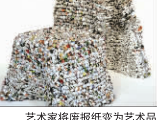
艺术家将废报纸变为艺术品

苏宁环球:举办低碳环保月 苏宁环球自6月15日起开展“低碳,让生活更美好”的全家福甄选活动,报名家庭须上传低碳生活小贴士,参与低碳家庭大比拼,胜出家庭即可获得由苏宁环球送出的1000元购物礼卡加3张世博门票。另外,活动期间,消费者可将废旧烟、锂电池送至苏宁环球回收站统一处理,即可获赠环保袋。