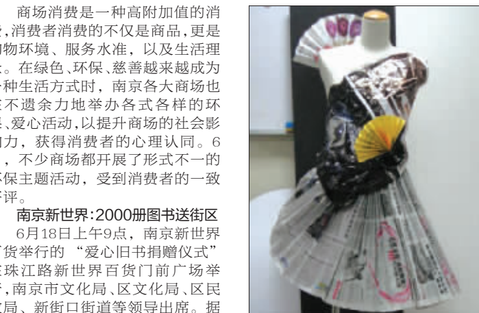
新世界橱窗里展出用报纸做的时装

商场消费是一种高附加值的消费,消费者消费的不仅是商品,更是购物环境、服务水准,以及生活理念。在绿色、环保、慈善越来越成为一种生活方式时,南京各大商场也在不遗余力地举办各式各样的环保、爱心活动,以提升商场的社会影响力,获得消费者的心理认同。6月,不少商场都开展了形式不一的环保主题活动,受到消费者的一致好评。