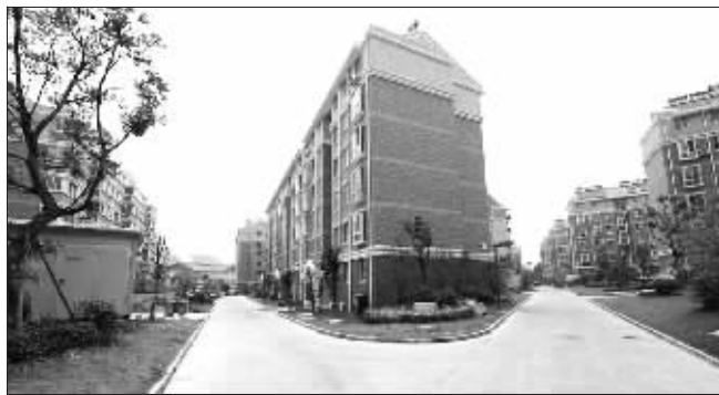
尧顺佳园

记者了解到,尧顺佳园的物业公司向300户居民预收下半年的物业费时,6天时间就交了230多户,很多住户觉得小区环境好、管理到位,每月0.15元/平方米的物业费没有理由不交啊。实际上,在对物业费上,栖霞区政府财政每平方米还补贴0.15元,另外区财政还按照每户100元/年的标准补贴给物业公司,不然物业公司亏损了,经适房小区还怎么管理?