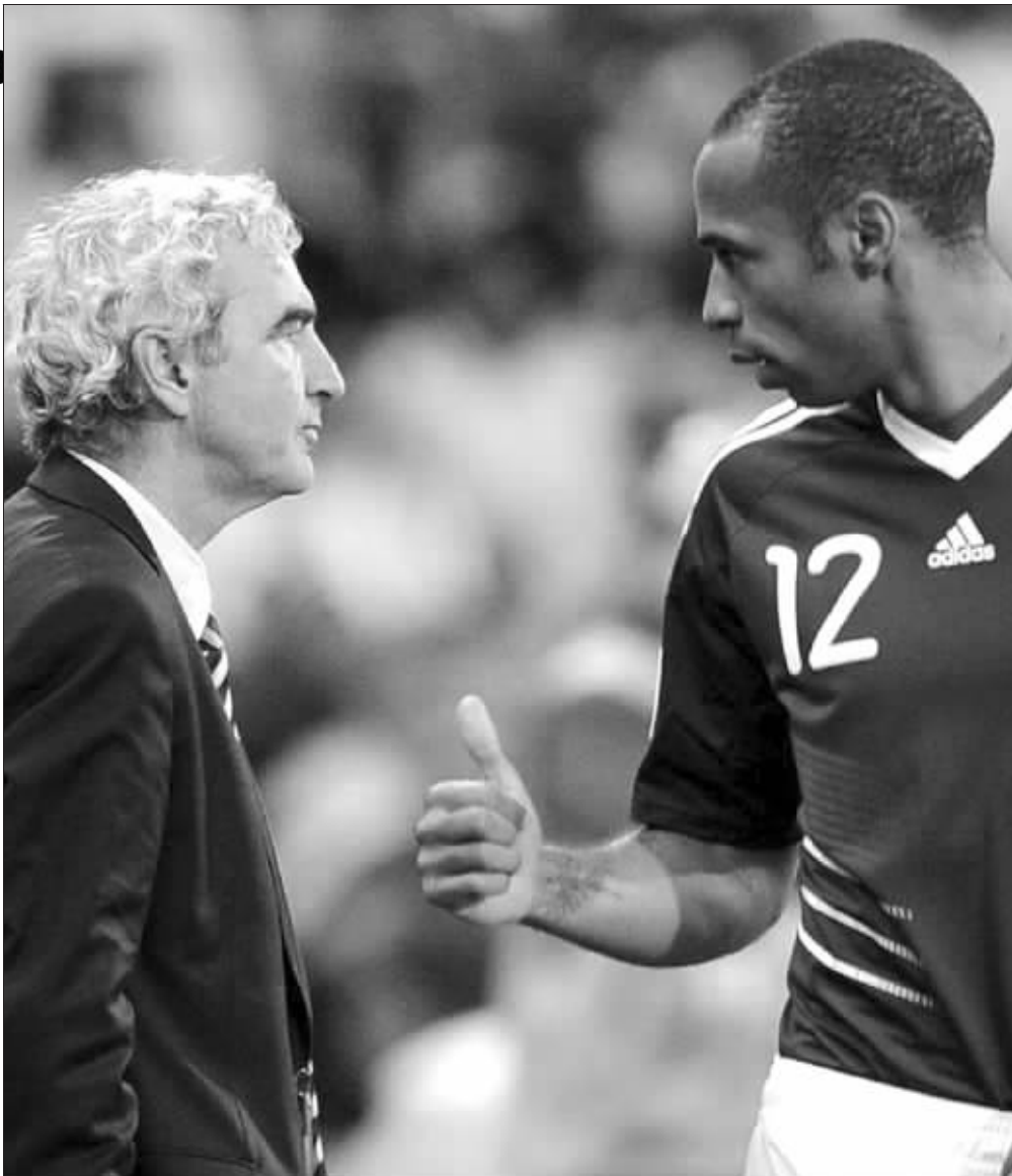
亨利冲着多梅内克翘起大拇指,很明显是在嘲讽他