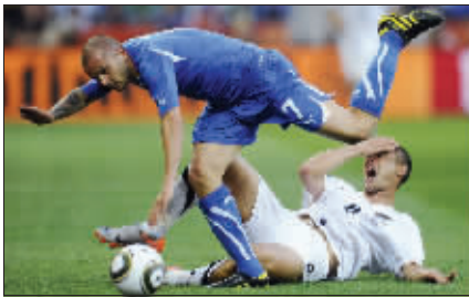
哎呀,看到了不该看的东西!