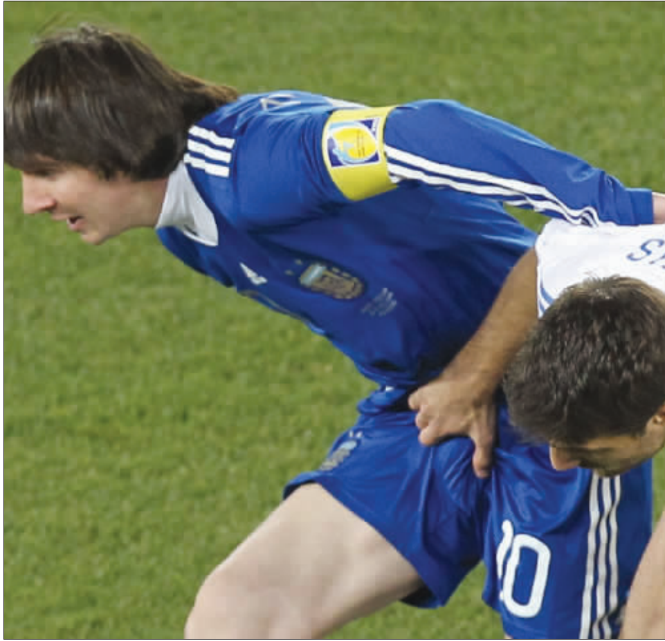
阿根廷对阵希腊,梅西惨遭“咸猪手”