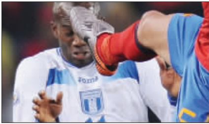
这脚下去,哥们就破相了