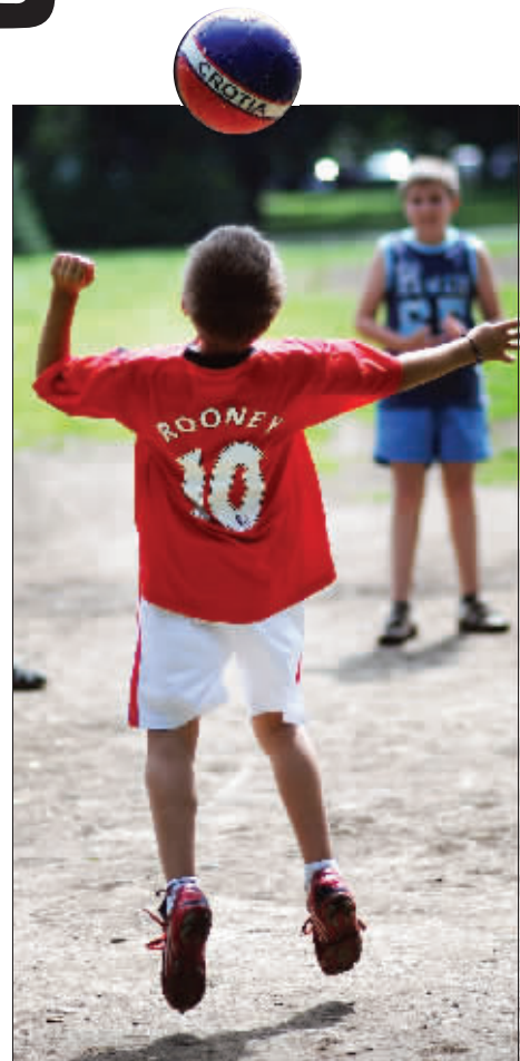
长大后,我就是鲁尼!