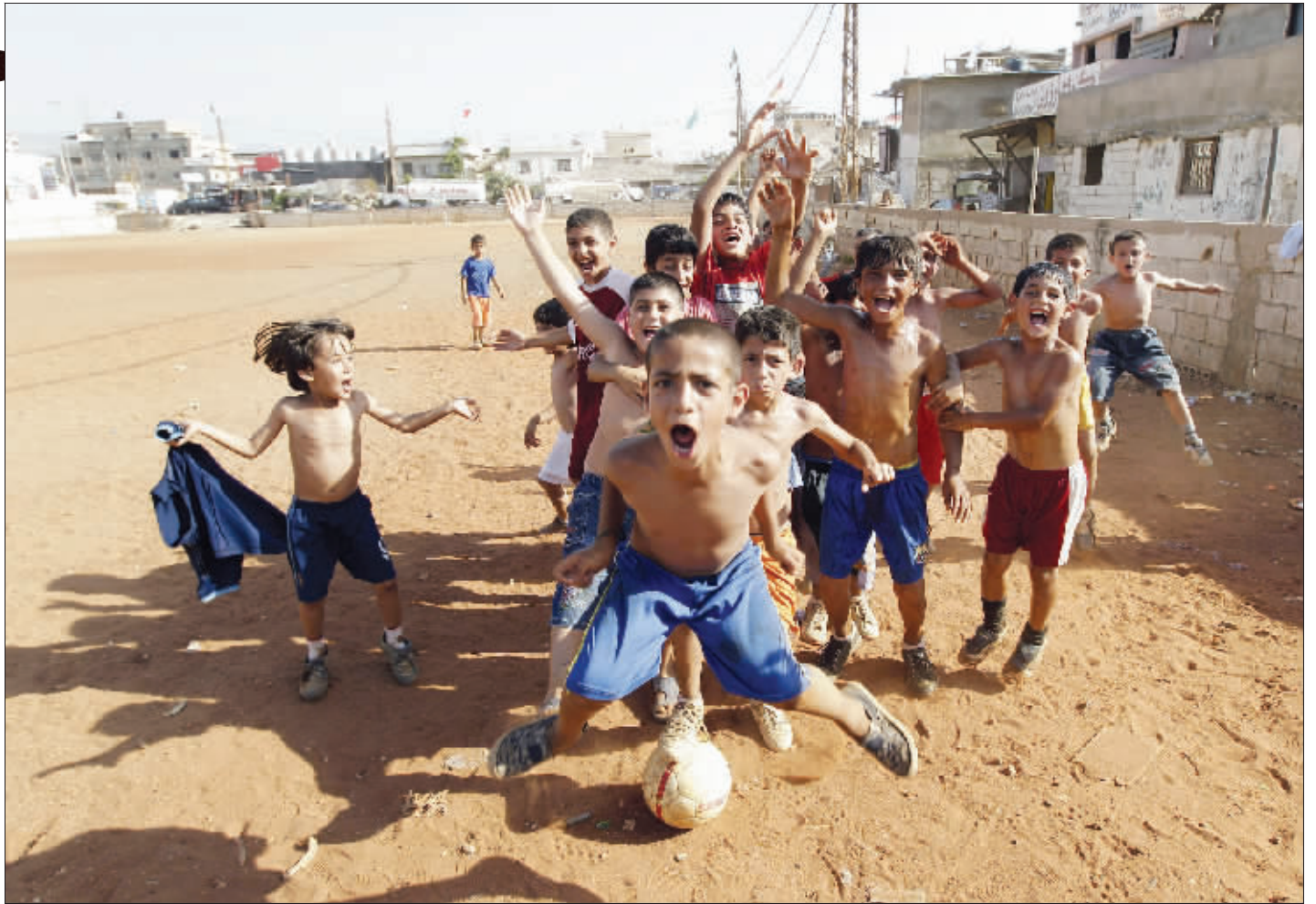
没有什么能够阻挡孩子们踢球的欲望。