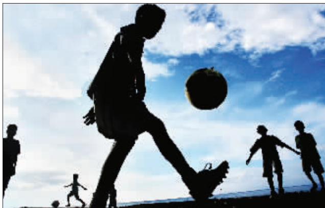
东帝汶首都帝力,儿童在海岸边踢足球