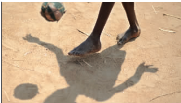
没有球鞋,照样踢得很开心