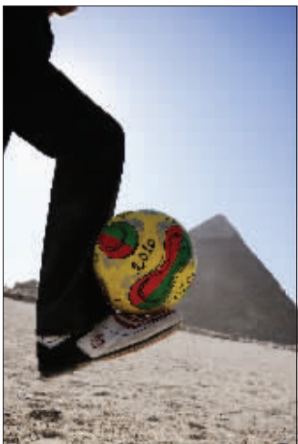
或许,下一个埃托奥将在这里诞生。