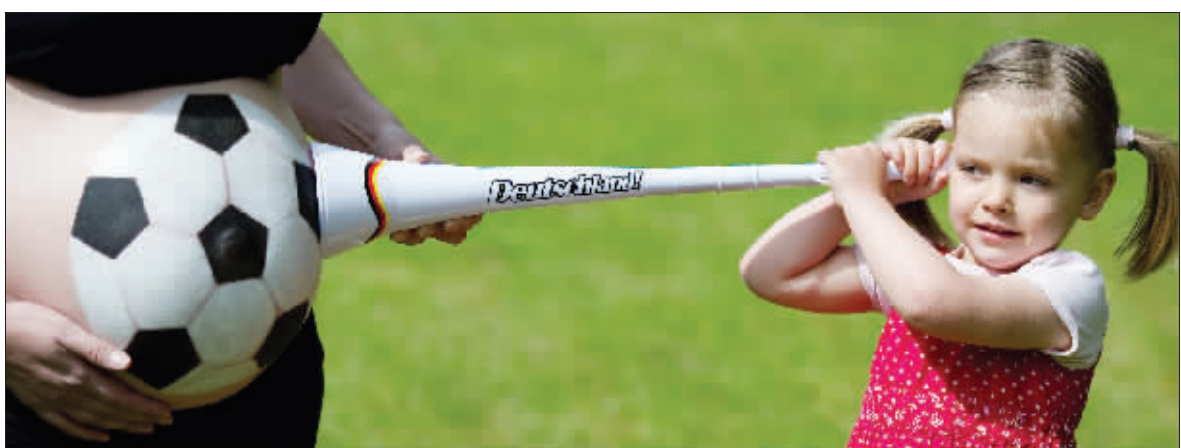
三岁的小女孩拿着瓦祖拉放在妈妈的肚子上,她的妈妈已经有九个月的身孕。