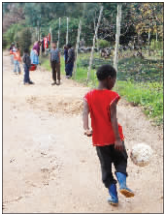
踢球,不仅在球场上。