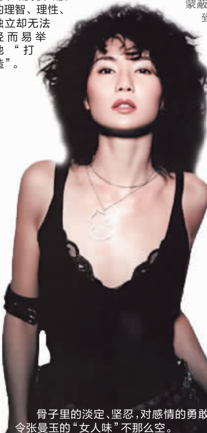
骨子里的淡定、坚忍,对感情的勇敢,都令张曼玉的“女人味”不那么空。