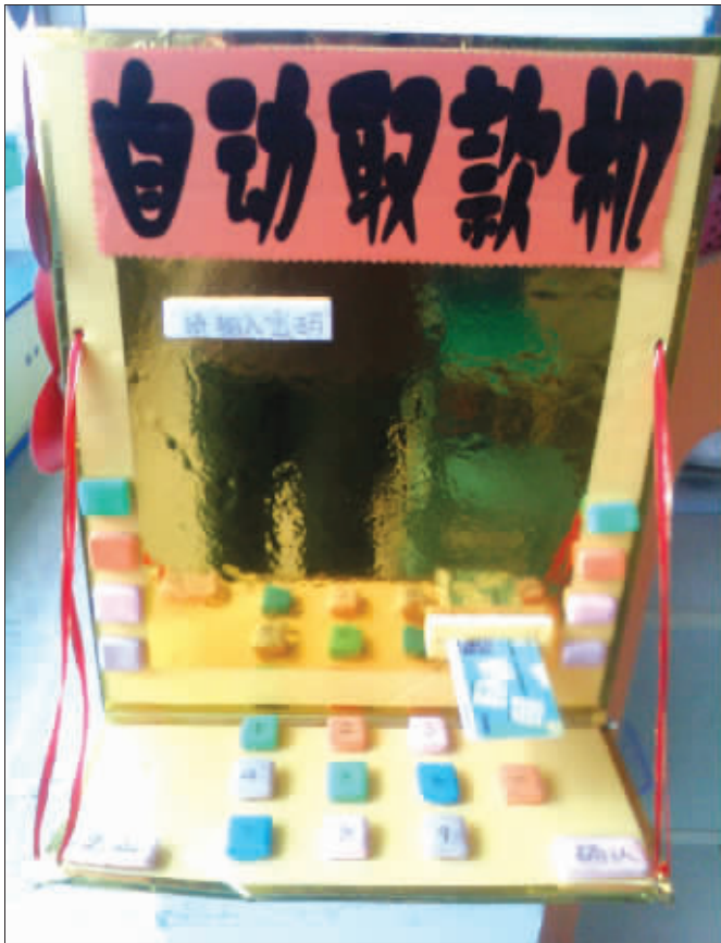
若真能吐出钞票来,我也好想有一台。特殊说明一下,这是小朋友们自己做的哦,材料是橡皮、泡沫和纸,好玩吧。6月20日摄于江宁机关幼儿园 (作者田野获30元话费)