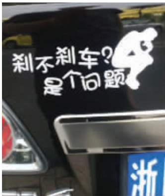
网友上传的搞笑车贴