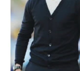
作为德国队主帅,主要工作就是帅