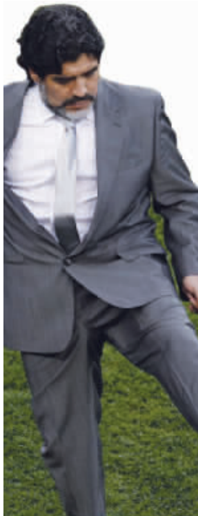
“看阿根廷教练在场边踢球的那两下,好像他以前也踢过球呀……”