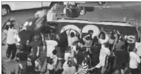
湖人蝉联NBA总冠军后,洛杉矶发生多起球迷闹事事件,多人受伤,20多名滋事者被当场拘捕。

面对科比的挽留,“禅师”并未松口,表示赢得总冠军令自己归来的机会增大了,“机会确实增大了,夺冠是美妙的事情,我现在只能说这么多。”