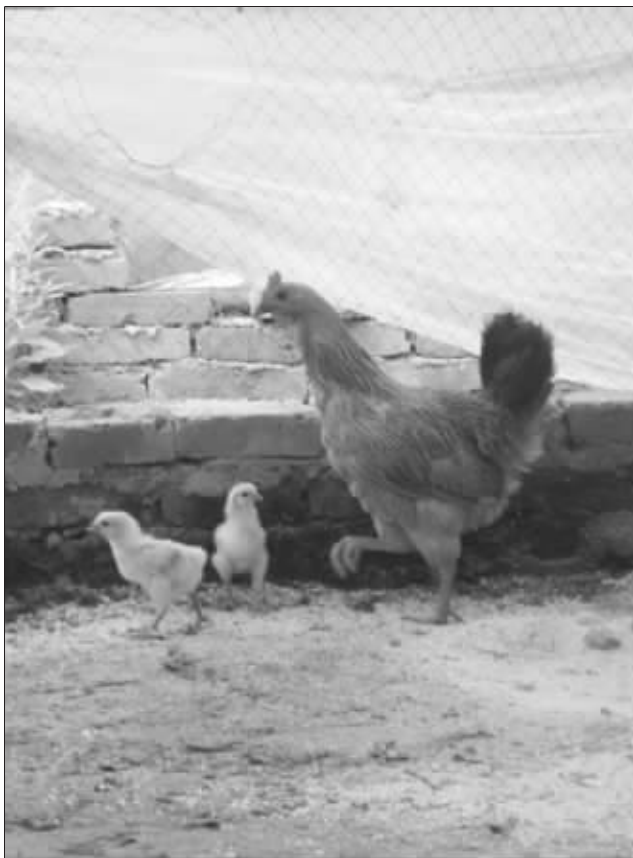
鸡妈妈总是将两只小鸡护在羽翼下

更多时候,鸡妈妈会带着鸡宝宝在王奶奶种植的枇杷林子里散步,过着安逸的日子。林子里还有成百上千只鸡,为了不让鸡宝宝被同类欺负,鸡妈妈总是寸步不离跟在鸡宝宝身后。偶尔有大鸡欺负鸡宝宝了,它会狠狠啄对方。