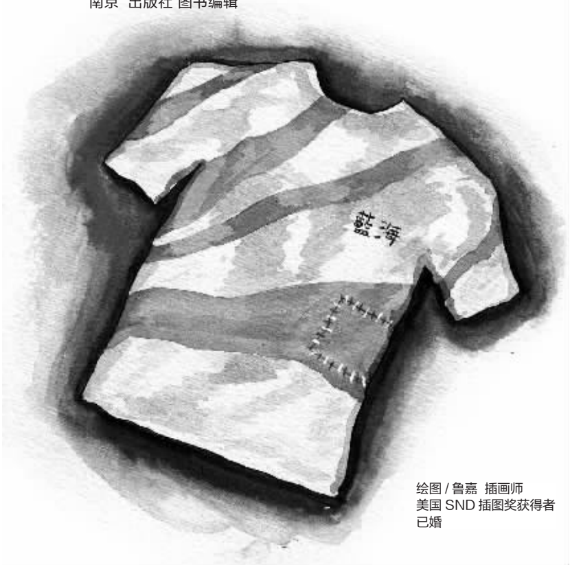
绘图/鲁嘉 插画师 美国SND插图奖获得者 已婚

上面的那块破处是我为他缝补的,蓝线代表他,白线代表我,一针一线织起的是我们曾经的美好。