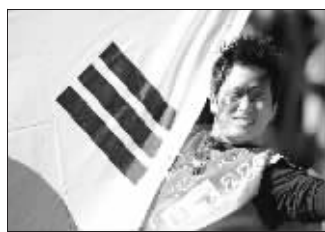
韩国球迷很狂热

昨天晚上,70万韩国球迷穿着红色的T恤在首尔市政厅广场上集会,为自己的球队助威,再次上演了“红魔”的疯狂。