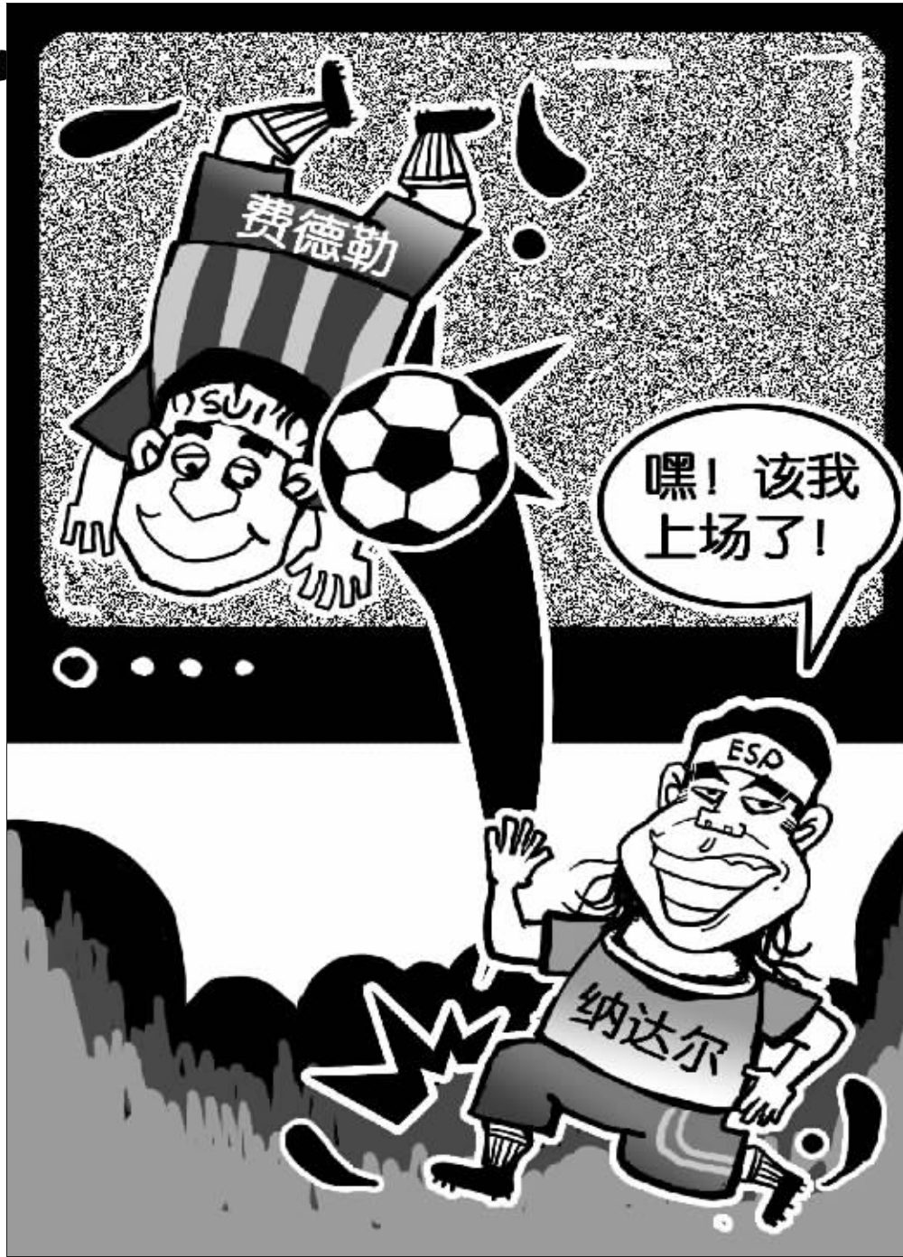
漫画 实习生 李曼凯

移动用户请编辑“902+用户名”,发至10665566089。短信资费:1元/条