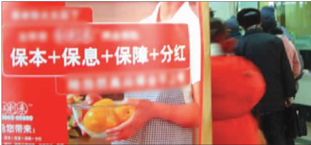
上海保监局全面排查分红险满期给付风险, 一石激起千层浪 资料图片

眼下, 叫卖不叫好的万能险悄然退市, 热卖的分红险未分红先爆给付风险, 倒是不被看好的投连险首季跑赢了大盘……看来, 保险还真不能只挑“红”的买。多家险企理财规划师表示, 并不是保险市场打太极, 而是保险理财本就重在保障, 切忌跟风投保。