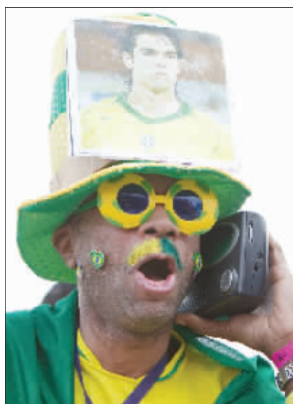
“喂,我在南非,信号不大好”