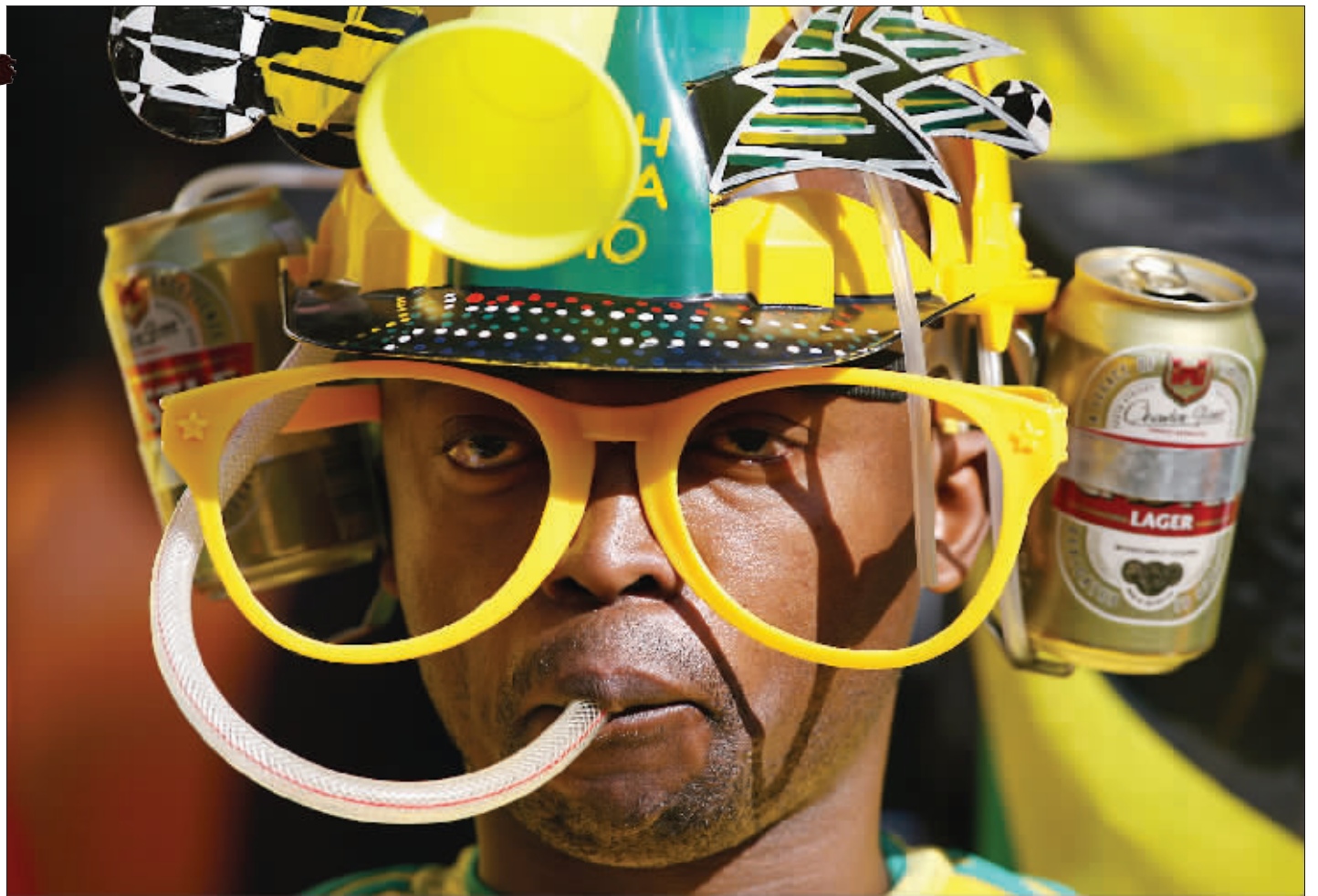
一身全自动装备,解放了双手