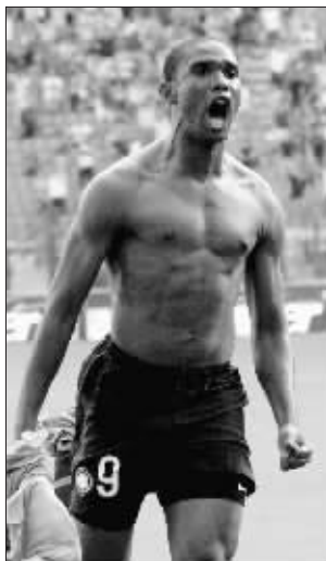
埃托奥的胸肌也得到女性青睐

就像男性一样，女性也会珍视胸部健壮的男人。埃托奥的胸肌发达但不累赘，属于刚好合适型。 肉价：虽然有一身漂亮的肌肉，但埃托奥的这身肉还没带来太多财富。埃托奥2009年总收入为1010万欧元，而他当年的工资高达950万欧元。