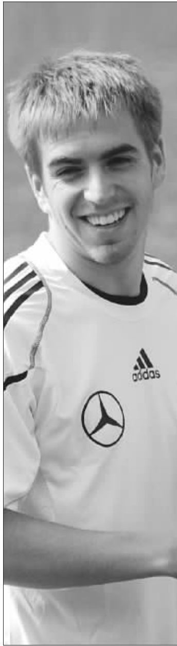
德国队和澳大利亚队同属刚猛一派,他们的交锋肯定是一场火星四射的比赛。