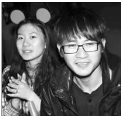
网友上传的韩寒和金丽华照片