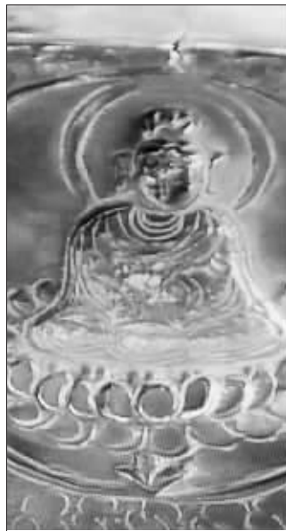
银函上的花纹依然清晰可辨