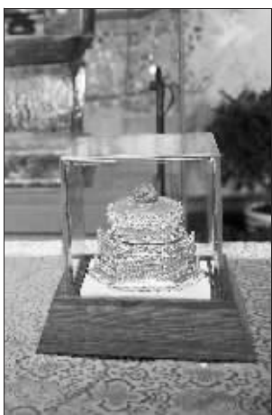
小小玻璃罩也是特制的

的科技条件,圣物出土一年多来,保护得非常完美。那么,栖霞寺有这个环境吗?有!这个环境,就是这个玻璃罩内的环境,这个外表普通的玻璃罩,是由上海博物馆特制的,玻璃罩的下面装有“机关”,放置了一些除湿、输入惰性气体的物品,同时可以保证玻璃罩内的温度都保持在18℃~22℃左右。