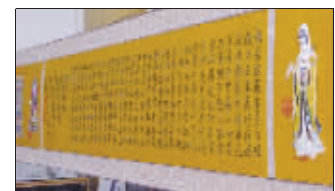
康熙手书心经织造品