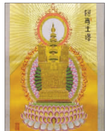
云锦研究所为法会织造的阿育王塔

专家表示,“这次重光意义极其重大,从顶骨舍利的寓意来说,也是级别最高的,那是最智慧头脑的象征。”专家说,这次佛顶骨、舍利重光供奉大典是一个非常好的契机,让世人重新认识南京在佛教界的地位,可以激活南京的佛教文化资源。南京大报恩寺遗址考古,它是肉身形成的舍利。