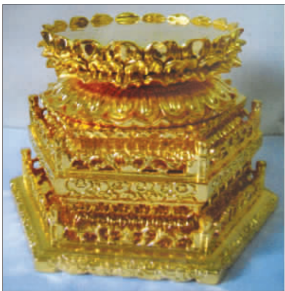
盛放圣物的楠木刻金宝座