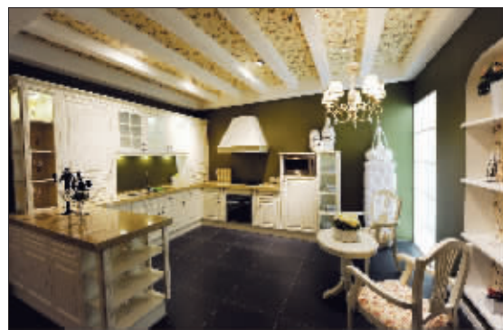
欧派女 性厨房—— 特琳娜

2010国际家装建材节 Festival Internacional Decoracion Materiales 2010国际家装建材节 Festival Internacional Decoracion Materiales 2010国际家装建材节 Festival Internacional Decoracion Materiales 2010国际家装建材节 Festival Internacional Decoracion Materiales