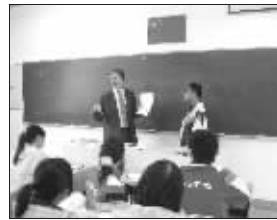
2009年签证官模拟签证

很多优秀的同学坚信“我将用高三一整年的时间全身心投入到SAT、托福等考试和申请大学过程中去,这就足够了,不需要参加中美班!”而事实上要出国的学生必须充分利用好高三这一年的时间,在有规划的安排中度过,全部时间和精力磨出来的语言高分并非你获得成功的唯一保障。再次以我们的毕业生为例,往往最后录取结果证明个人素质都不错的同学恰恰是从不缺课、不折不扣完成各项学习任务的学生。相反,自己请假在家复习的同学成绩并非最好,很多学生会出现一整年比较懒散的学习现象。中美班的学生可以在一群有着共同梦想的同龄人、有着丰富中学经验的老师引导,以及高质量的全英文环境的熏陶中有效地向着美国顶尖的大学迈进。这一年的体验带来的将是学生们受益终身的良好学习习惯和踏实的学习作风。