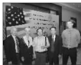
美国总领事会见金陵中学副校长及中美ES项目教师

也许有的家长会问“中介也可以帮我们申请到很好的大学,我为什么要让孩子选择中美班?”中介固然在申请大学过程中可以省去家长和学生很多时间和精力,但是学生应该扮演申请大学的主导角色,需要全程参与,这本身也是提高自身素质的有效锻炼和在美国学习生活的预演。高三这一年的时间至关重要,国外大学竞争产出是众所周知的,申请到好大学并非遥不可及,可是在好的大学中顺利毕业并取得成功却并不容易。中美ES项目的宗旨不仅仅是把学生送