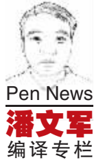
Pen News 潘文军 编译专栏