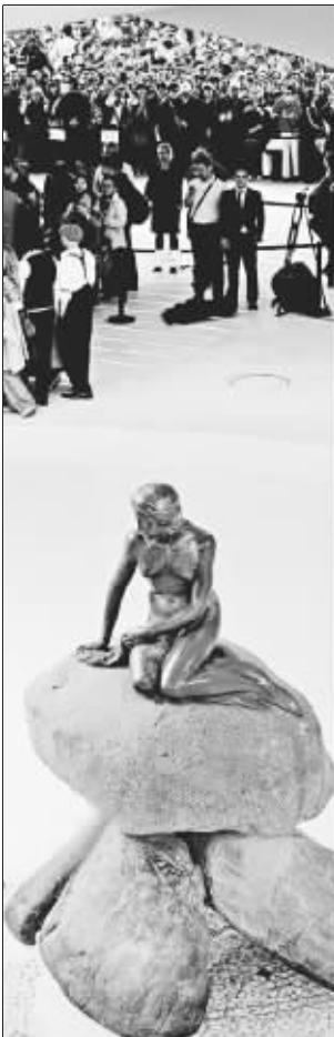
世博丹麦馆的小美人鱼上保险了吗?

“市面上的短意险产品可以提供基本保障功能。”人保南京分公司寿险部秦经理介绍,“一般100元/张的保险卡保障期一年,保险利益包括意外身故