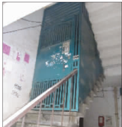
一楼和二楼之间安装了防盗门

老新村改造安装电子防盗门应该是好事,可是最近快报却接到不少针对电子防盗门的投诉。有读者说防盗门质量有问题,也有读者投诉安装防盗门并不像宣传的那么及时。记者介入后,有关方面表态:将尽快解决居民们担心的问题。