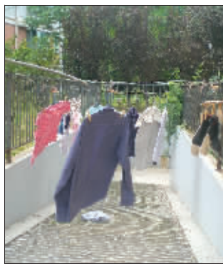
闲置的车库门前晾满衣服

据了解,仅301号一幢楼就有72户人家,紧挨着的几幢楼都没开通车库。整个三期有1000多户住户,这么大的需求量让仅有的地下车位显得“捉襟见肘”。“这一年内,我们一幢楼被