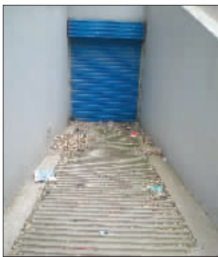
紧闭的车库门前扔满香烟头

对此,金佳物业给出的解释是,已开的车库车位完全够用,如果车位拥挤则会另开车库。业主对此说法进行了反驳,“虽然2008年这里入住的人并不多,车