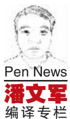
Pen News 潘文军 编译专栏

罗伯特·福尔肯·斯科特,英国海军军官和极地探险家。1910年,斯科特从英国出发,第二次探险南极,他这次的目标是要成为第一个到达南极点的人。但他发现这次他有一个竞争者:罗纳德·阿蒙森。斯科特的五人探险队于1912年1月17日到达南极点,却发现阿蒙森比他们早到了一个月。在返回南极洲边缘的路途上,他们遭遇极强的寒冷低温,五人先后遇难。