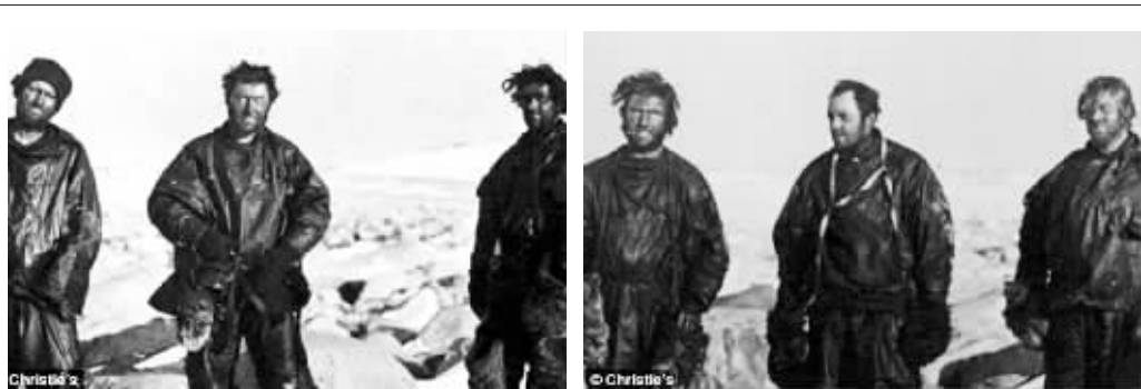
从左到右:迪卡森、阿博特、布朗宁

1913年1月26日,在斯科特开始他的“死亡探险”两年之后,坎贝尔探险队完成了最后一个科考任务,启程回家。