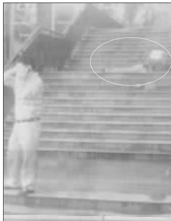
录像中白衣男子不救人反而毁灭证据