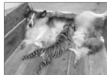
仅剩的一只小虎由母狗喂养