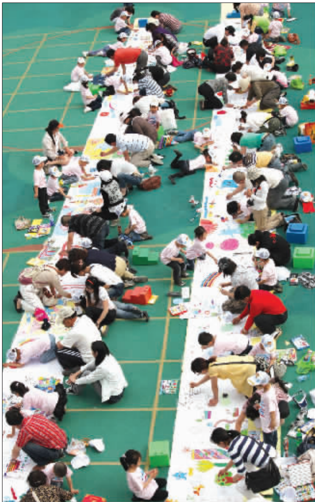
图为南通师范第一附属幼儿园小朋友以及家长现场作画