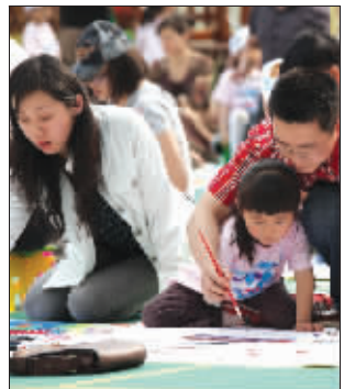
图为南通师范第一附属幼儿园小朋友以及家长现场作画

据悉,目前距离团体报名截止日期还有3天时间,全省共有329家幼儿园参与了这次江苏史上规模空前的儿童创意绘画大赛。从5月12日组委会收到首幅参赛作品至今,已经有28家幼儿园递交的1300余幅作品率先完成了“集结”,这些作品中既有内容的创新,也有表现手法的突破,小画家们的创作热情直逼6月的艳阳。组委会负责人提醒心动还没有行动起来的团体和个人,快来搭乘报名的末班车吧!小朋友们和家长们共同登录都市圈网点点周刊频道( http://bbs.dsqq.cn/thread-256134-1-1.html ),一起欣赏小画家们的精彩创作吧!