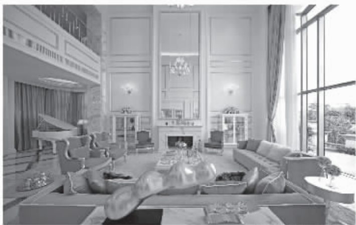
锦华装饰经典案例