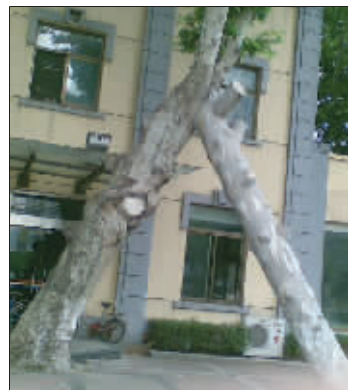
我漂亮,所以我够资格显摆!摄于丽江郊外 (作者雷国俊获30元话费)