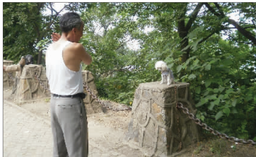
老人家,不管它做错了什么,看在如此诚恳的分上,就原谅它吧。6月2日摄于紫金山 (作者马女士获30元话费)