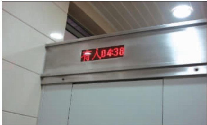
某网友公司卫生间电子显示屏

员工和老板之间博弈,向来就是道高一尺魔高一丈,员工沉迷开心网,老板就封杀开心网;员工上班聊QQ,老板就屏蔽QQ……网络玩不成,只能开小差了。卫生间成为开小差的最佳途径,蹲在卫生间,玩玩手机抽支烟,难熬的一天也就过去了。如此消遣,老板“周扒皮”自然不甘心。日前,有网友晒出老板奇招,卫生间采取计时制,上卫生间最多不超5分钟,否则,卫生间大门将自动打开,让你蹲在厕所无地自容。