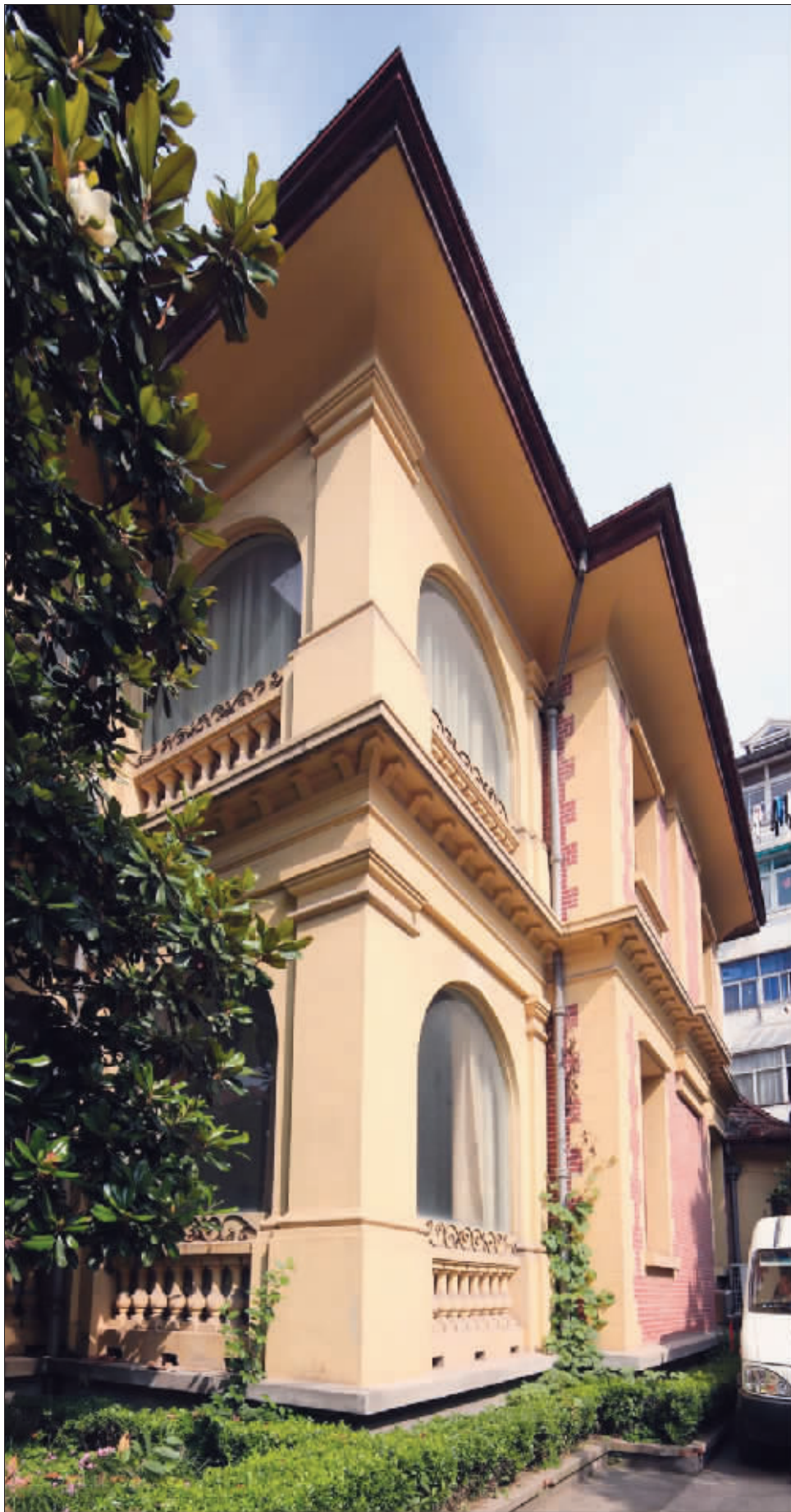
掩映在绿树丛中的俞大维公馆就像他的主人一样低调

俞氏公馆是一栋欧式建筑,楼高三层,部分为二层,虽然不及周围建筑的高度,但景致幽美,绕屋绿树蔽日。红砖墙面,间以黄色拉线,房顶则为黄红色,呈四坡形状。内部重新装修过,但基本结构没有改变,保存得相当完好,现为江苏省邮电建设工程有限公司的办公房。据陪同前来的鼓楼区文化局张殿亮介绍,该建筑2008年被江苏省列为第三次全国文物普查重要新发现,已申报第七批全国重点文保单位。若九泉有知,大维先生应会感到欣慰的吧。