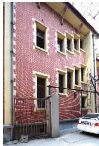
沿着楼梯开的窗户,可以最大限度采光