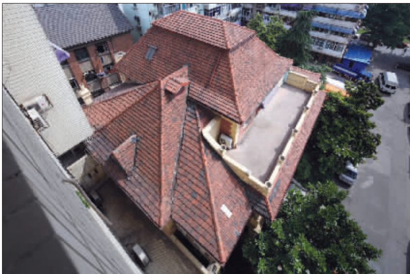
黄红色的屋顶呈现出精巧的几何形状