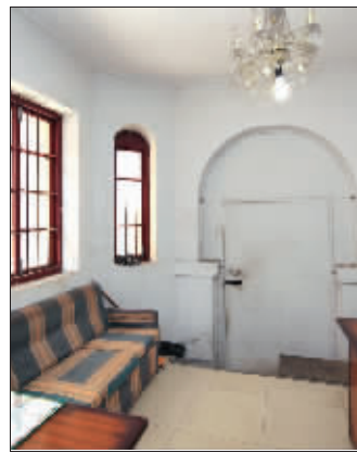
室内重新装修过,结构没变