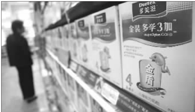
6月4日，消费者在上海一超市挑选奶粉

从去年开始，西南地区持续的干旱对三七的影响开始显现，今年3月，曾经每公斤不足百元的三七迅速攀升至单价500元，随后，部分地区出现的囤积居奇甚至让这一数字冲至每公斤700元。