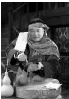
和谐的郭版李大嘴