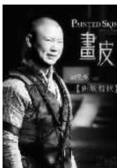
表情纠结的斩妖情侠