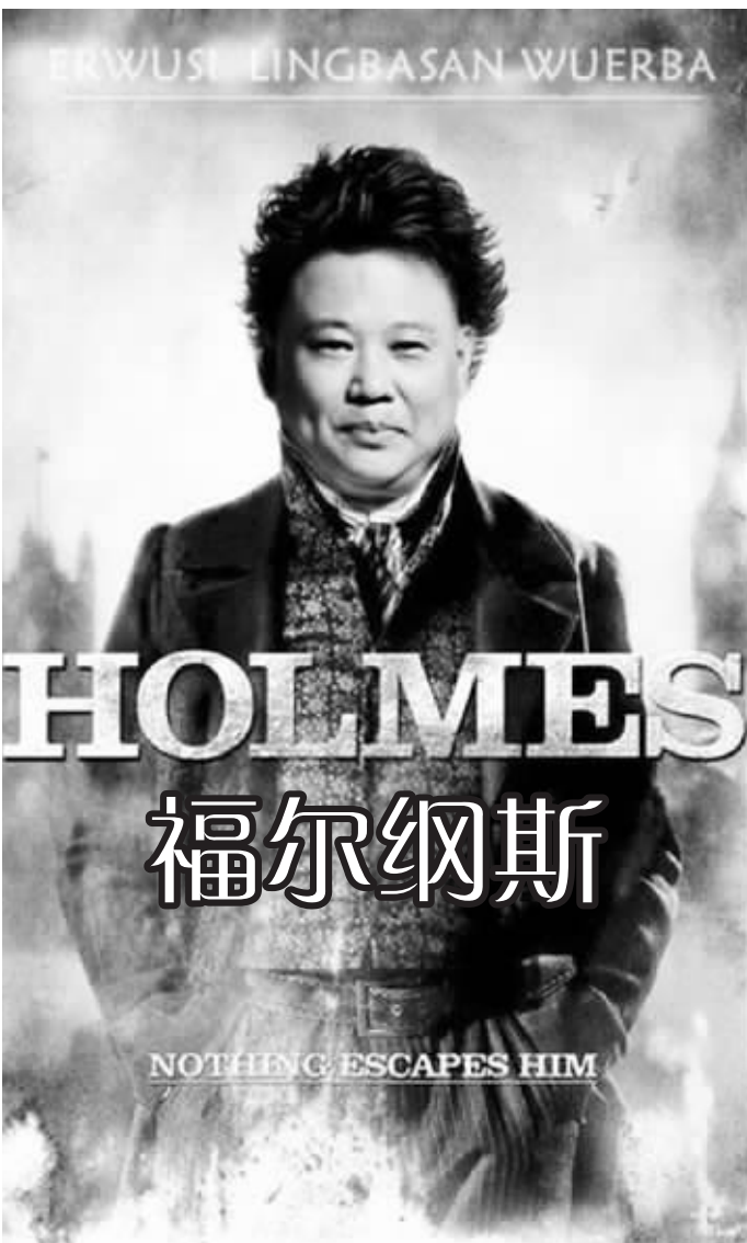
福尔纳斯,又名福尔·德纲·摩丝·郭