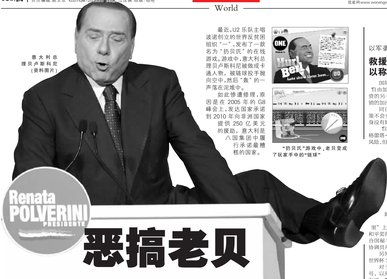
意大利总理贝卢斯科尼(资料图片)