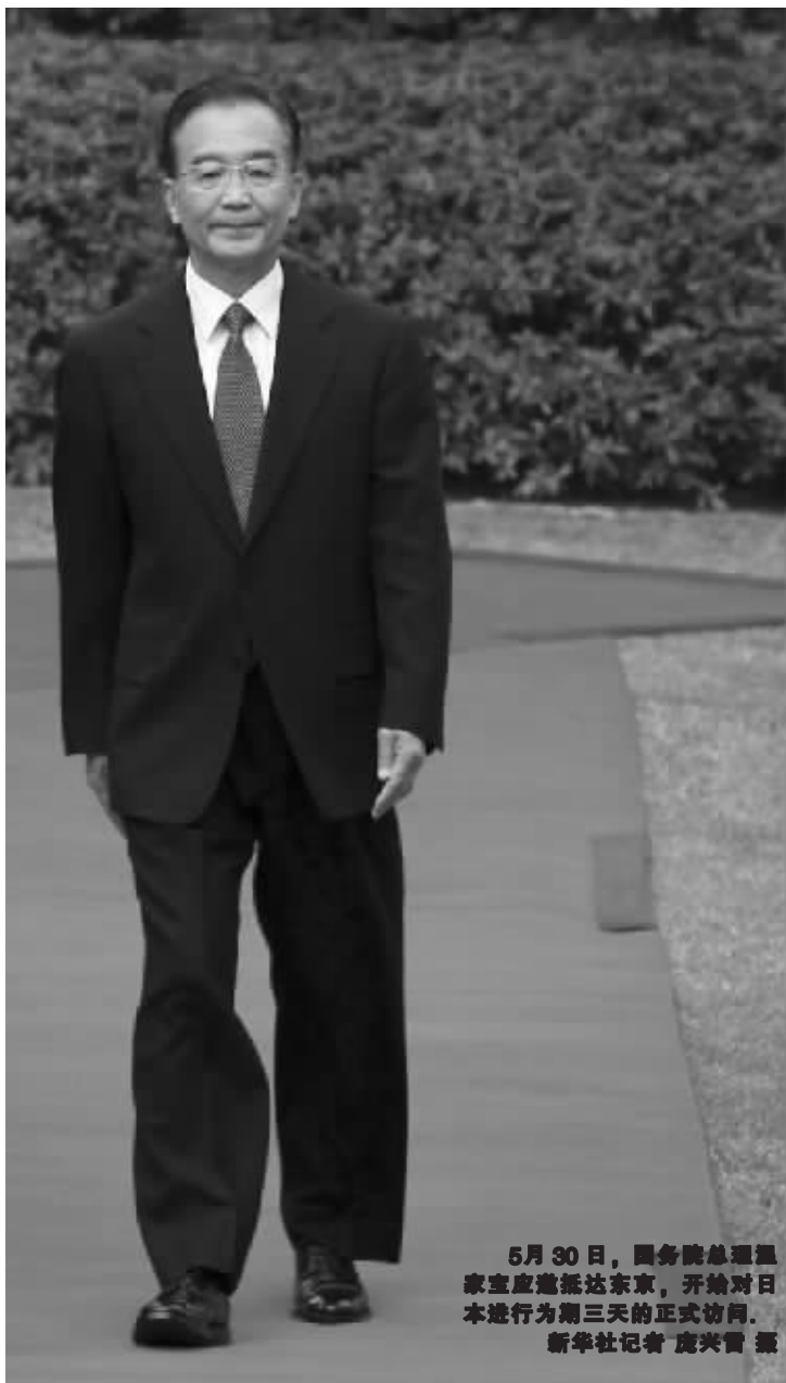
5月30日,国务院总理温家宝应邀抵达东京,开始对日本进行为期三天的正式访问。