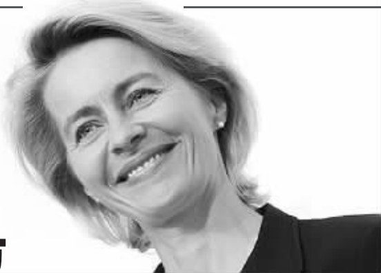
德国52岁的女劳工部长乌尔苏拉·冯·德莱恩

温家宝:我多次表示,我们不袒护任何一方,我们会秉持公正的立场,但是我们对问题看得更为深远,也就是说任何处理方式都要从根本上有利于半岛和平稳定。