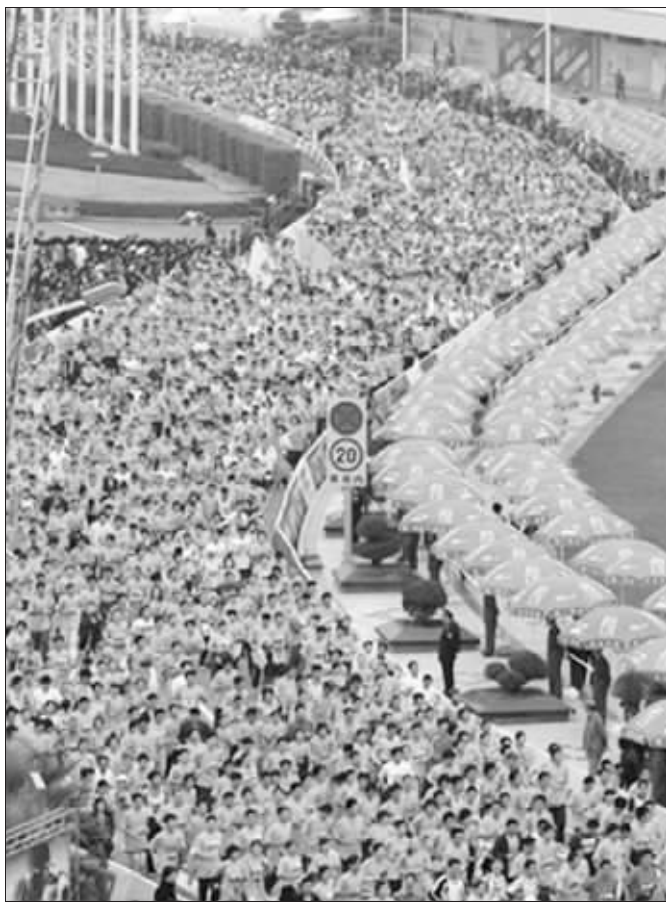
厦门马拉松赛一时盛况 资料图片