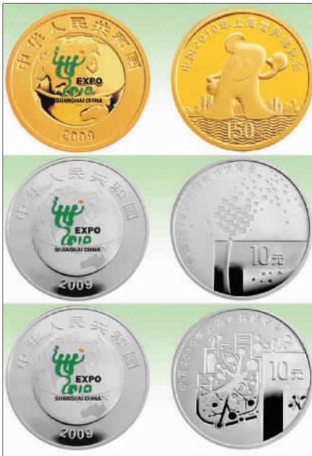
世博会金银币 资料图片

目前正在热卖的世界金条中,金银纪念币比世博金条还要走俏。日前,记者从商场和金币公司了解到,世博金银币打破“见光死”怪圈,世博会开幕已一个月,价格一直坚挺。据介绍,中国金币总公司共发行了两