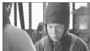
给曹操提鞋的太监(第1集)