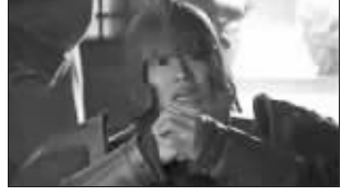
曹操手下的卫兵(第25集)