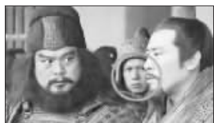
刘备身旁的将军(第17集)