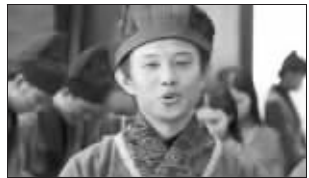
曹操给关羽送礼的家丁(第23集)