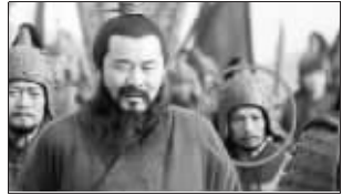
曹操手下的将军(第23集)