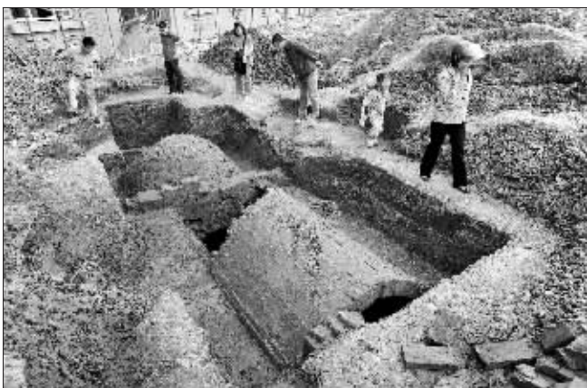
又挖出一个古墓,村民们都跑过来看热闹

村民告诉记者,这里正在修建江宁区聋哑学校。工地施工人员刘师傅说,5月28日上午,他带着工人们在挖下水道,挖土机挖着挖着,突然一铲子下去冒出一股水流,他们就停下来,发现铲斗里的土很松。“我觉得可能是