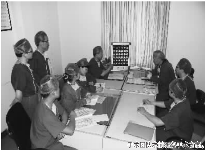
手术团队术前研究手术方案。

2009年10月2日,南京建国男科医院迎来了一批特殊的患者,由十二位中国台湾早泄患者组成的团队来到该院接受早泄手术。医院专家组对此进行充分部署,前期对患者都进行了严格的检查,根据每个人的不同