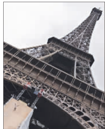
格瑞斯落下的瞬间

法国人泰夫·格瑞斯于5月29日成功刷新单排轮滑最高自由落体吉尼斯世界纪录。数千名游客及巴黎当地居民见证了这一历史时刻。