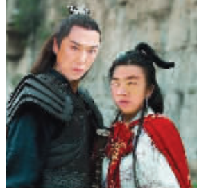
网友PS的各种版本貂蝉