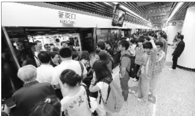
通勤首日,赶着尝新鲜的南京人不少