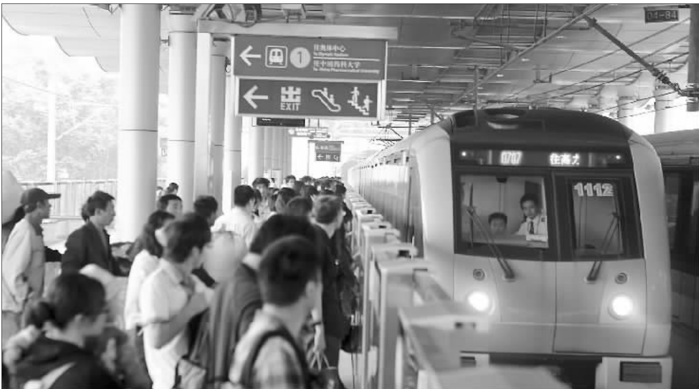
地铁1号线南延线“安德门站”昨成为早高峰期间客流量最大的换乘车站

他都在记录时间,“回去给自己订一份时间表,上班就再也不用担心迟到了。”6:42,百家湖站到了。黄先生匆匆下车时,还不忘看手表告诉记者:“呵呵,平时这个时候,我才刚刚下40路。”