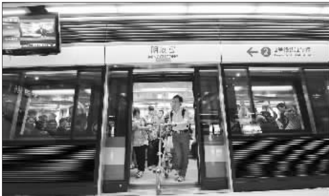
到站了,真是太快了