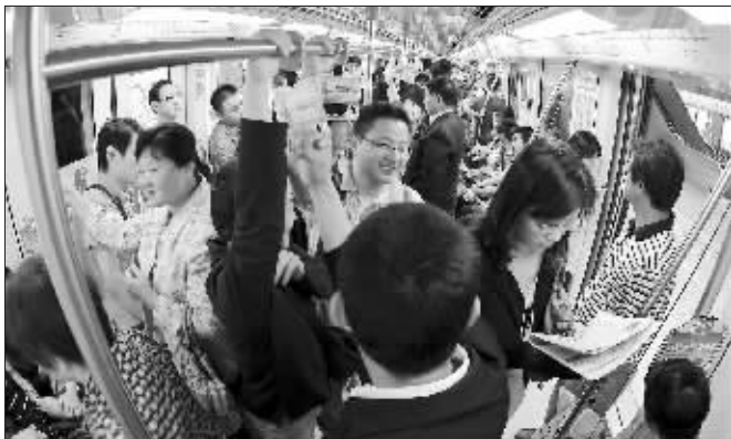
虽然是人挤人,但乘客的脸上带着笑容