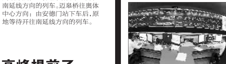
主控中心是地铁的“心脏”