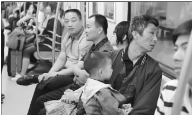
坐在地铁上顺便欣赏窗外风景