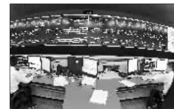
主控中心是地铁的“心脏”