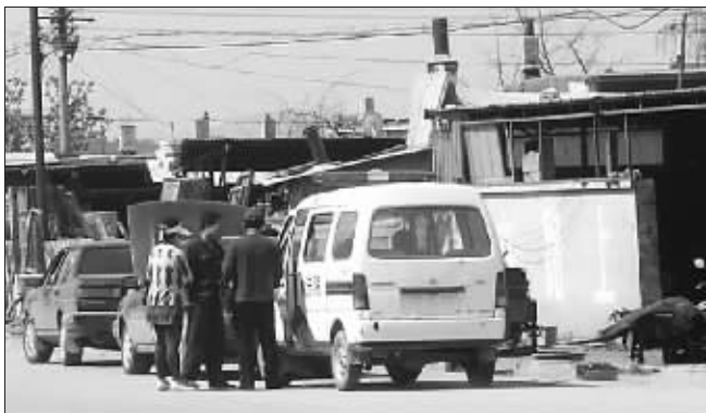
路边标有“法院”的无牌执法车