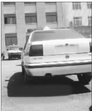
城管局大院里的无牌执法车

一位网友发帖称,近日自己到辽宁营口市盖州市办事,发现街上跑的警车没挂车牌,他用相机拍了几十辆,涉及公安、法院、综合执法等各种执法车辆,绝大部分没有车牌,他把这些无牌执法车的照片发到了网上,引发网友强烈关注。